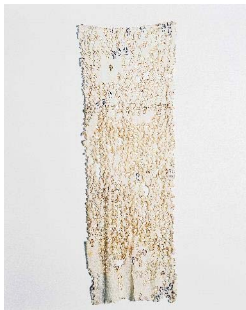
ROSANA PALAZYAN Sem título , 1994 Tela quemada y bordada. 150 x 96,5 cm Donso en Patricia Prieto de Cisneros, en honor a Susana Steinmetz

Las obras del argentino Eduardo Costa (1940) incluidas en este conjunto - Cuña blanca (1998-1999) y Black Cube (1998-1999)- corresponden a propuestas del artista acerca de la pintura, creando sus llamadas “pinturas volumétricas”, formas escultóricas construidas exclusivamente con pintura.