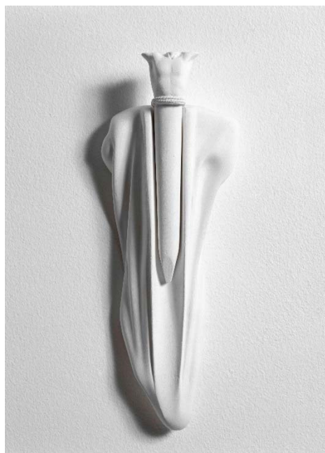
MAURICIO RUIZ Sem título , 1995 Yeso 30,5 x 10,8 x 6,4 cm Donación Patricia Phelps de Cisneros

Valeska Soares (Brasil, 1957) se destaca en la vanguardia brasileña desde finales de los 80 hasta principios de los 90. Desde 1992 su obra se posiciona en múltiples plataformas, centrándose en temas como el mundo artístico globalizado, la geografía, la identidad cultural y nacional, la disciplina o la forma. Sem título (from Detour) (2005) y Wishes 22 (1996) son las creaciones de este autor que pasan a formar parte de la Colección del Museo.